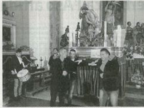
Il gruppo della Flagellazione che si sposta verso l'altare

camente, quando i gruppi venivano scesi dalle loro cappelle all'interno della chiesa di San Michele per essere trasportati nell'altare centrale, si faceva questa cerimonia con passi ben precisi scanditi dallo squillo della tromba e dall'accompagnamento del tamburo che determinava lo spostamento. Dopodiché si faceva una preghiera in segno di buon auspicio per la processione". Il rito si è aperto con il trasporto a spalla delle aste dalle sedi dei ceti dei muratori e dei fornai alla chiesa delle Anime Sante del Purgatorio alla presenza di tutti i consoli. Il corteo si è quindi diretto ver-